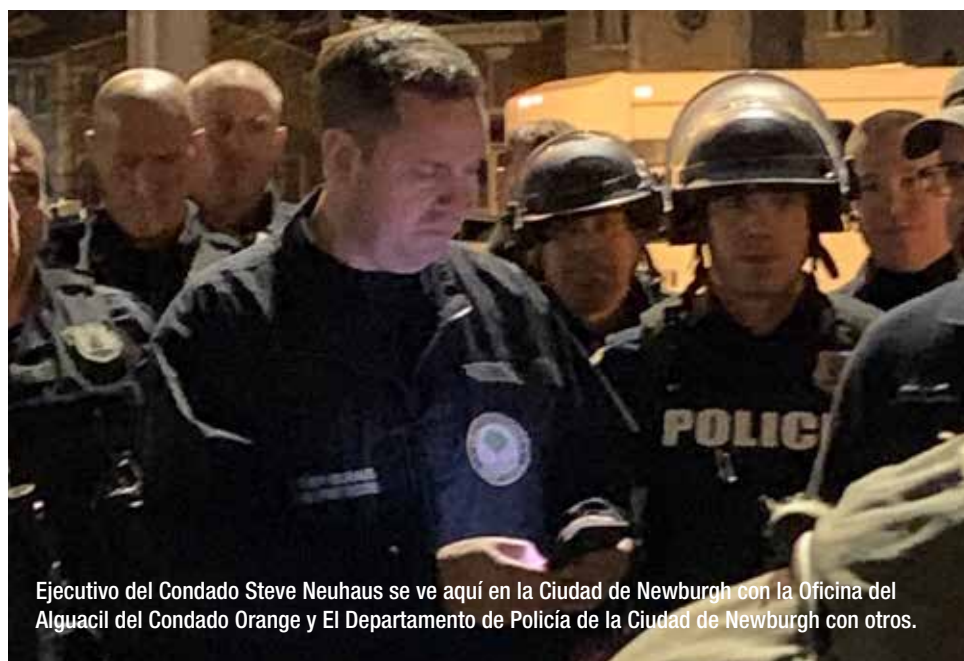
Ejecutivo del Condado Steve Neuhaus se ve aquí en la Ciudad de Newburgh con la Oficina del Alguacil del Condado Orange y El Departamento de Policía de la Ciudad de Newburgh con otros.

Nuestros equipos de oficiales de aplicación de la ley continúan dedicándose a hacer su trabajo bien en todo el Condado de Orange. Nuestros policías siguen comprometidos a proteger a todas las comunidades del Condado de Orange las 24 horas del día. Si le preocupa la seguridad pública y cómo se cumplen las normas de distanciamiento social establecidas por el gobernador, comuníquese con el departamento de policía local o la Policía del Estado de Nueva York.